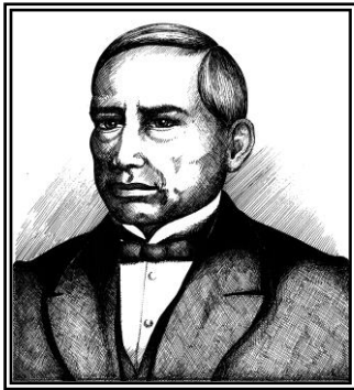
Benito Juárez García

Estos personajes gobernaron a nuestro país al mismo tiempo